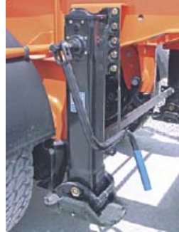
Pies de apoyo con 2 velocidades y compensación