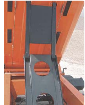
Estabilizador entre chasis y caja