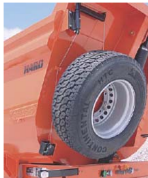
Soporte de rueda de repuesto frontal