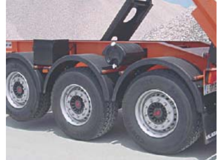
Guardabarros termoplástico con faldones anti-spray, cajón de herramientas y depósito de agua