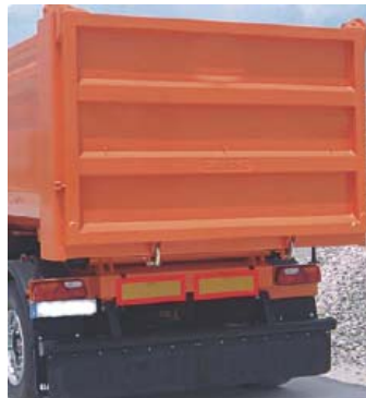
Puerta trasera de apertura automática y para-golpes desmontable