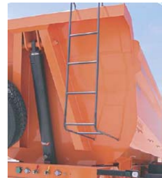
Cilindro hidráulico frontal y escalera de acceso a la caja